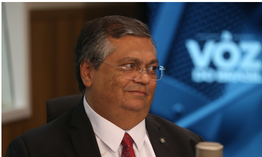
FLÁVIO DINO EXPLICA PAPEL DE NOVA CORPORAÇÃO FEDERAL DE SEGURANÇA

O governo federal deve apresentar, nos próximos dias, a proposta de criação de uma Guarda Nacional permanente e de segurança pública para proteger os prédios públicos federais em Brasília e atuar em operações especiais em terra indígenas, área de fronteira, unidades de conservação e apoio à segurança dos estados.