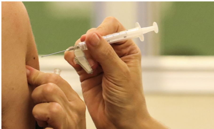
PACIENTE É MULHER COM ESQUEMA VACINAL COMPLETO

O Ministério da Saúde comunicou a notificação de um caso da variante EG.5 do coronavírus SARS-CoV-2 em São Paulo. A paciente, uma mulher de 71 anos, apresentou os primeiros sintomas da doença em 30 de julho e já se recuperou, de acordo com o Centro de Informações Estratégicas em Vigilância em Saúde (Cievs).