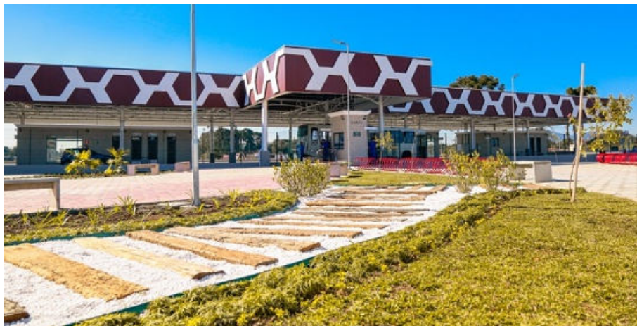
Novo Terminal fica na Av. São Roque esquina com Av. Frei Rui Guido Depiné (Antiga Av. Brasília), Jardim Santa Mônica

No próximo sábado, dia 05 de agosto, será inaugurado o Novo Terminal de Piraquara, resultado de uma parceria entre a Prefeitura de Piraquara e a Agência de Assuntos Metropolitanos do Paraná (AMEP). O investimento do Governo do Estado foi de R$ 14,1 milhões para a construção do terminal e uma área de esporte e lazer adjacente. O projeto teve início em 2019 com um estudo de viabilidade